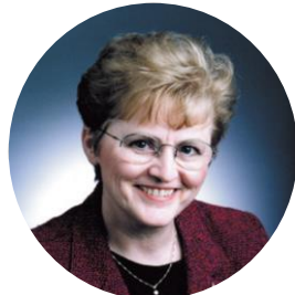
Elaine Biech Build a Successful Leadership Development Program: A Crowdsourcing Experience