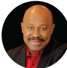
Jim Smith From Good to Great to Grand! Superize Your Platform Skills