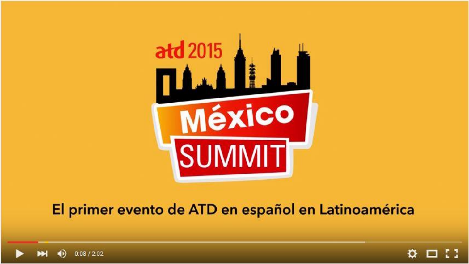
ATD 2015 Mexico Summit Official Video